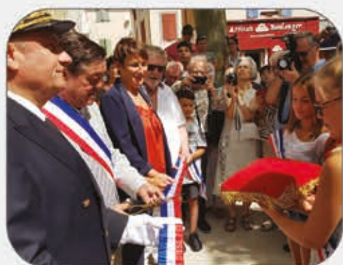
Inauguration du cours Jean Jaurès rénové