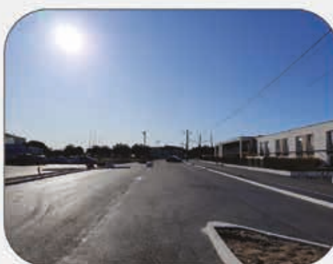
Aménagement du parking de l'école F. Dolto